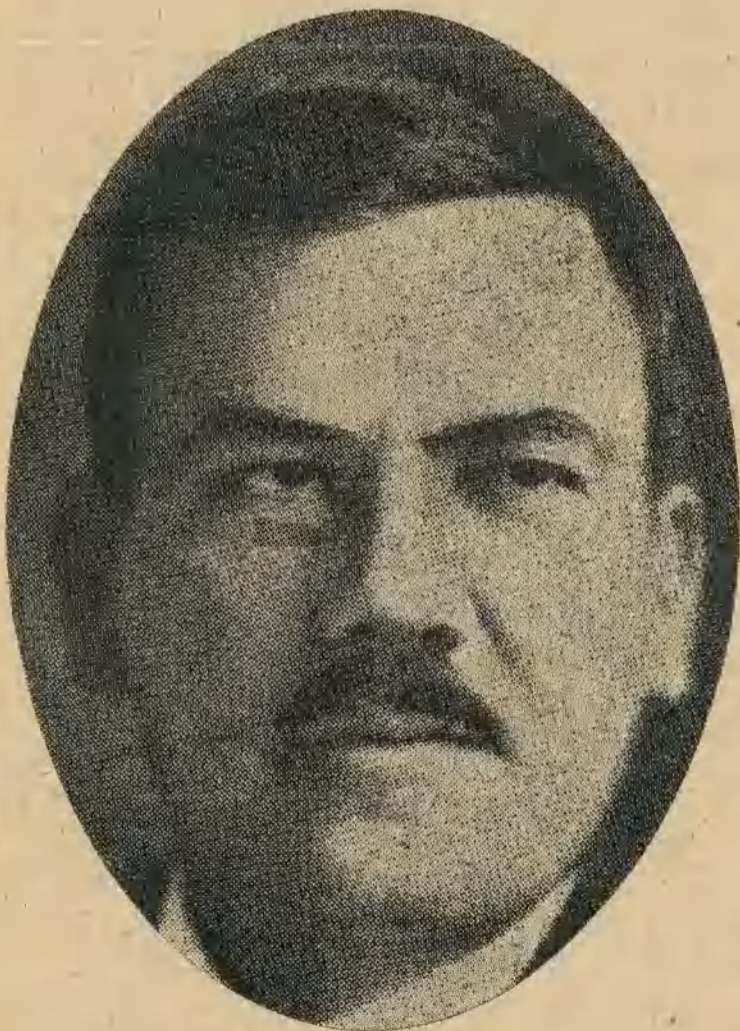
General Plutarco Calles, ex-presidente de México

clasista y doctrinal de la Revolución. La amenaza insurreccional de Gómez y Serrano, dramáticamente liquidada con el fusilamiento de ambos candidatos, sirvió para afirmar y reforzar la unidad revolucionaria. Las divisiones y quereilas internas de este bloque eran ya inquietantes; pero la autoridad de Obregón conseguía dominarlas temporalmente, siendo sin duda este factor el que había aconsejado la designación de un candidato contra el cual iba a invocarse los principios y orígenes anti-reeleccionistas de la revolución mexicana.