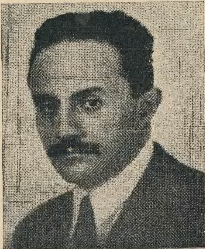
José Vasconcelos, posible candidato a la presidencia de la república mexicana

Entre los candidatos de esta tendencia, con mayor proselitismo, uno de los más indicados hasta ahora es el general Aaron Sáenz, gobernador del Estado de Nueva León. Aa-