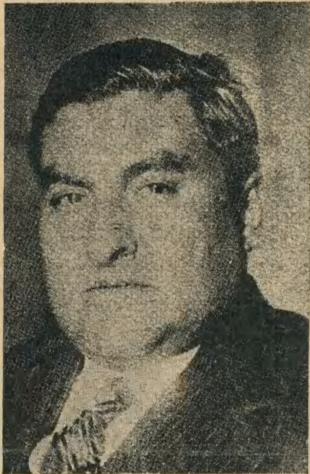
Emilio Portes Gil, Presidente Provisorio de México

La situación eleccionaria mexicana se presenta esta vez más compleja que hace un año cuando, próxima la terminación del mandato del general Calles, se concentraron las fuerzas políticas que sostenían al gobierno alrededor de la candidatura del general Obregón, contra las candidaturas anti-reeleccionistas de los generales Serrano y Gómez. Entonces, la formación de un frente único obregonista aseguraba la victoria del bloque popular, defensor de los principios de la revolución, que había gobernado desde la desaparición de Carranza. Más bien, el bando anti-reeleccionista concurría dividido a la votación. La Crom (Confederación Regional Obrera Mexicana), representada en el gobierno de Calles por su famoso líder Luis Morones, Ministro de Industria, Comercio y Trabajo, apoyaba a Obregón, quien a su fuerza personal de caudillo sumaba la compacta adhesión del haz de fuerzas populares representativas del sentido