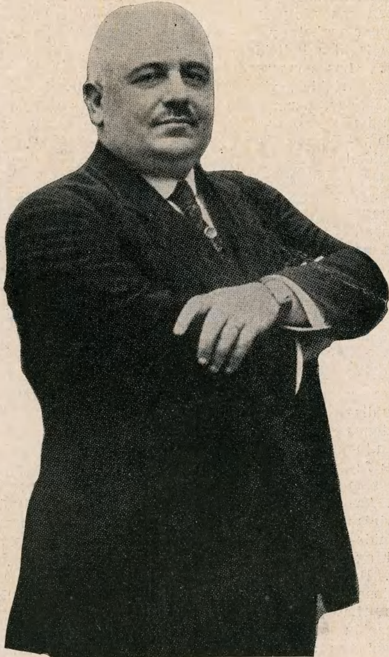
Francisco Nitti, expresidente del gobierno italiano

Nitti es un italiano meridional. Sin embargo, no es el suyo un temperamento tropical, frondoso, excesivo, como suelen ser los temperamentos meridionales. La dialéctica de Nitti es sobria, escueta, precisa. Acaso por esto no conmueve mucho al espíritu italiano, enamorado de un lenguaje retórico, teatral y ardiente. Nitti, como Lloyd George, es un relativista de la política. No lo atrae la reacción ni la revolución. No